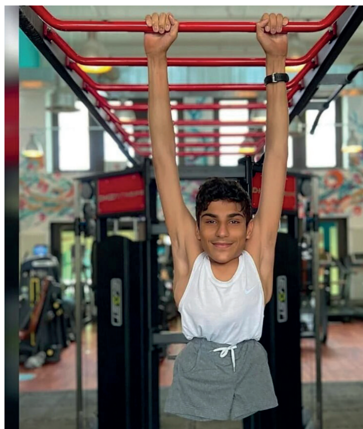
Ghanim Al-Muftah superou uma síndrome rara e se tornou um palestrante famoso no Catar

Através da própria história, Ghanim ajuda na conscientização de sua síndrome e de outras deficiências. Para ele, o apoio de sua família lhe dá coragem para enfrentar seus desafios. “O momento que para mim tem mais significado é ver minha querida mãe e meu pai orgulhosos de mim e de tudo que conquistei”, declarou. “Estes momentos são exatamente como se estivesse me reabastecendo, eles me encorajam a continuar e fazer meu melhor para ver o brilho nos olhos deles”.