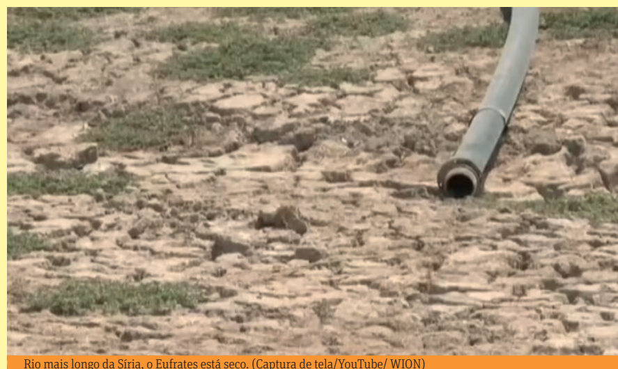
Rio mais longo da Síria, o Eufrates está seco.

“Uma seca contra as suas águas, para que se sequem! Pois é uma terra de ídolos; Eles estão obcecados por suas imagens terríveis. Certamente, gatos selvagens e hienas habitarão [ali], e avestruzes habita-