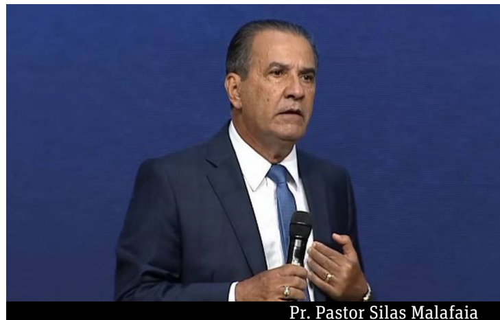
Pr. Pastor Silas Malafaia