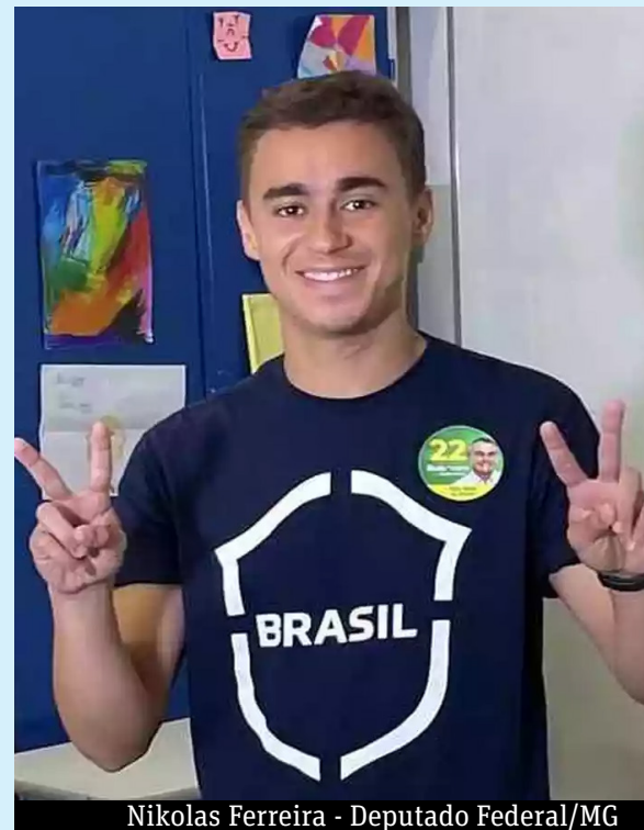
Nikolas Ferreira - Deputado Federal/MG

Pela terceira vez Lula (PT) irá presidir o Brasil. Sua posse será no dia 1º de janeiro de 2023. Ele comandou o país entre 2003 e 2010, e seu governo foi marcado por inúmeras denúncias de corrupção.