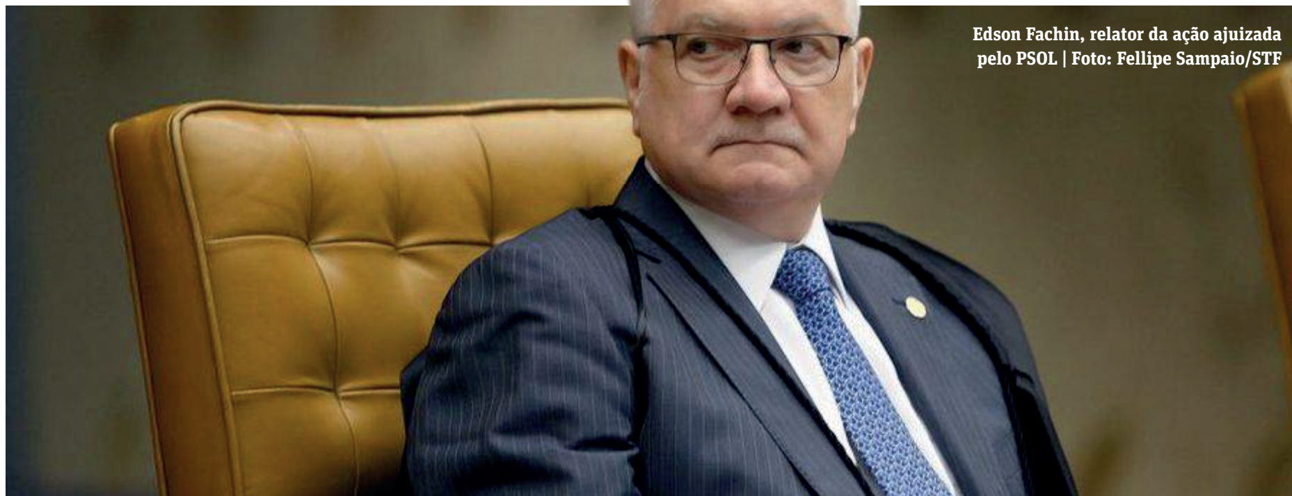
Edson Fachin, relator da ação ajuizada pelo PSOL