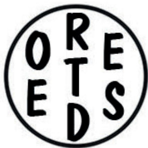
LUGAR ONDE ELE FOI MORAR DE ABRAÃO