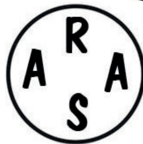
NOME DA ESPOSA DE ABRAÃO