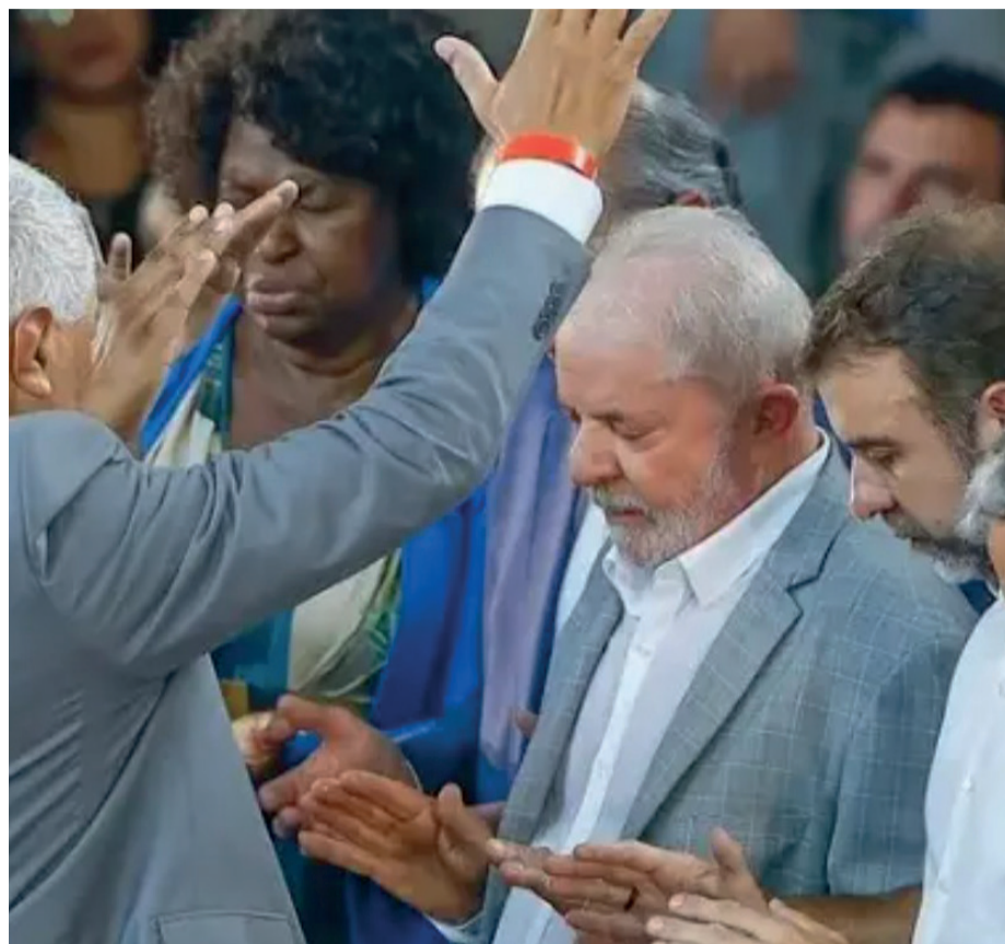
Lula (PT) reuniu representantes de segmentos evangélicos em evento no Planalto.

Conforme apurado pela Revista Veja, a iniciativa reflete uma tentativa do PT de ampliar sua base de apoio em um segmento que tradicionalmente tem se mostrado resistente às pautas progressistas defendidas pela legenda.